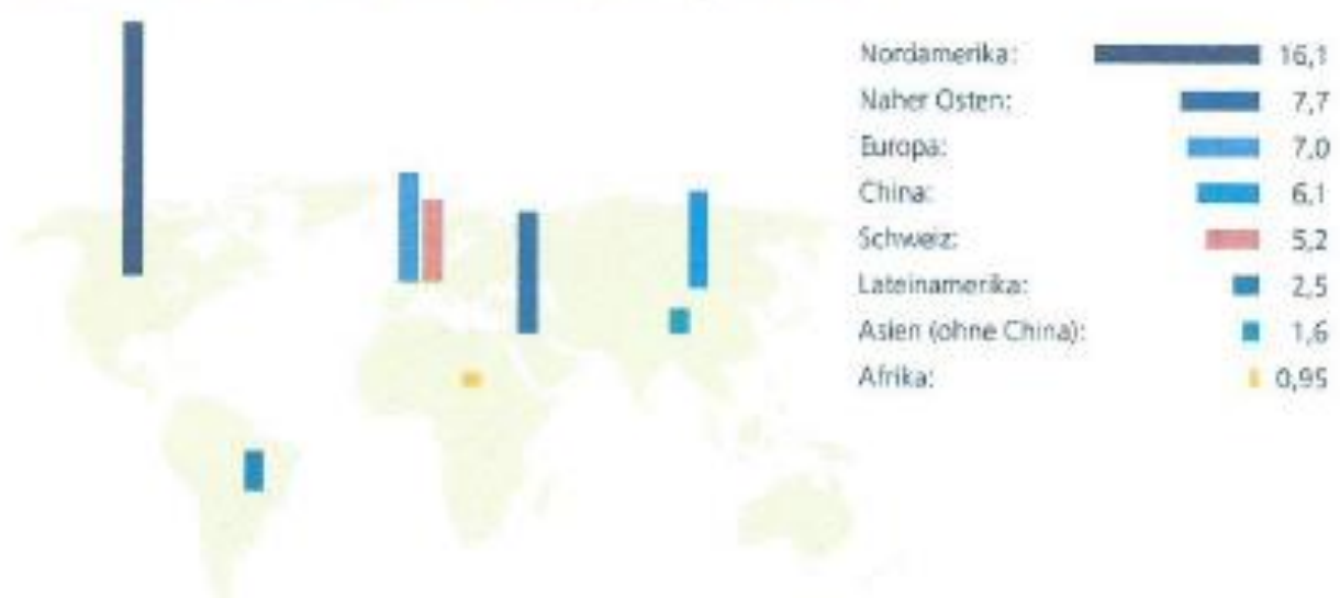
CO 2 -Emissionen aus der Verbrennung fossiler Brenn- und Treibstoffe, Tonnen CO 2 pro Kopf (2014)

Die Zahlen beziehen sich ausschliesslich auf die CO 2 -Emissionen aus der Verbrennung fossiler Brenn- und Treibstoffe. Andere Treibhausgase sind nicht berücksichtigt.